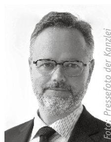
RA Jens Wilhelm V